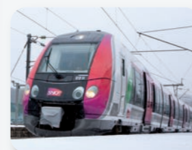
Plan de modernisation des trains