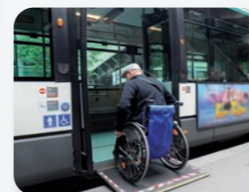
Schéma directeur de l'accessibilité