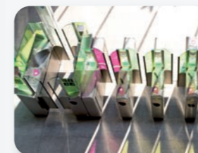
Programme de rénovation des gares et stations