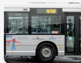
Développement des liaisons de Grande Couronne