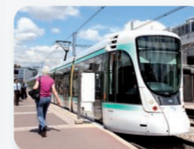
Extension de lignes de métro et de tramway