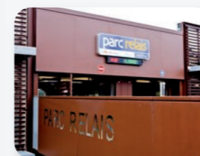
Intermodalité et restructuration des pôles d'échanges