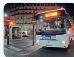
Extension du réseau des bus de nuit

Adapter les transports aux nouveaux rythmes de vie et aux évolutions des territoires sont ainsi des objectifs permanents pour le STIF, acteur majeur de la mobilité durable en Île-de-France .